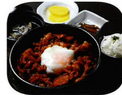
豚しゃぶ長いも丼

豚肉は地元産のやわらか肉が魅力の国産豚「さくら201」 サクサク歯ざわり、そして粘り強いのが自慢の町内産「長いも」使用。