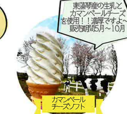
カマンベール チーズソフト