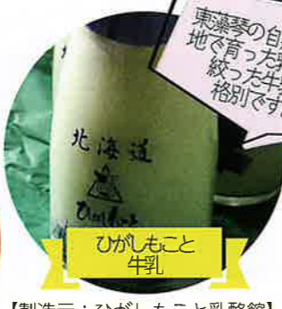
ひがしもこと 牛乳