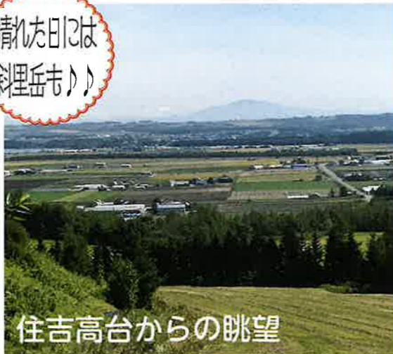
住吉高台からの眺望