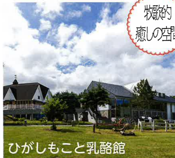
ひがしもこと乳酪館