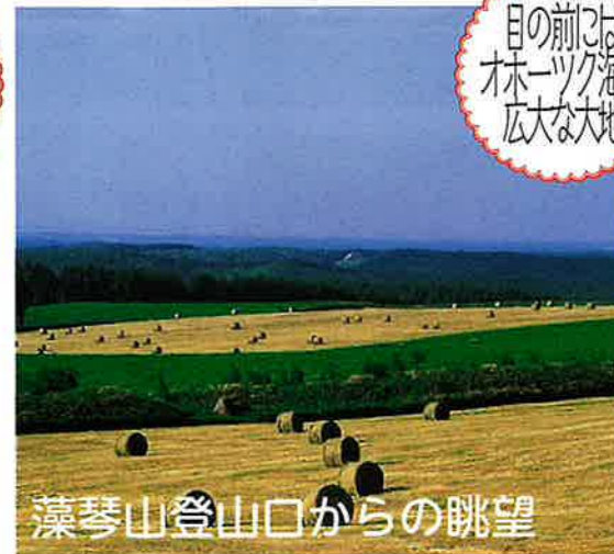
藻琴山登山口からの眺望