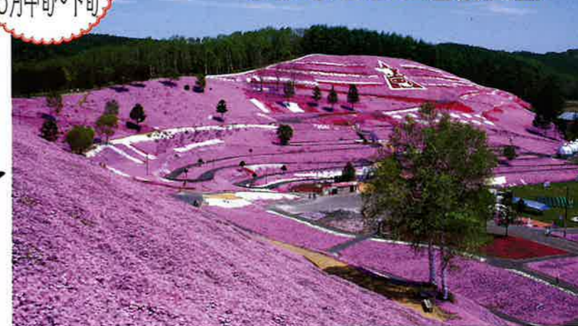
ひがしもこと芝桜公園