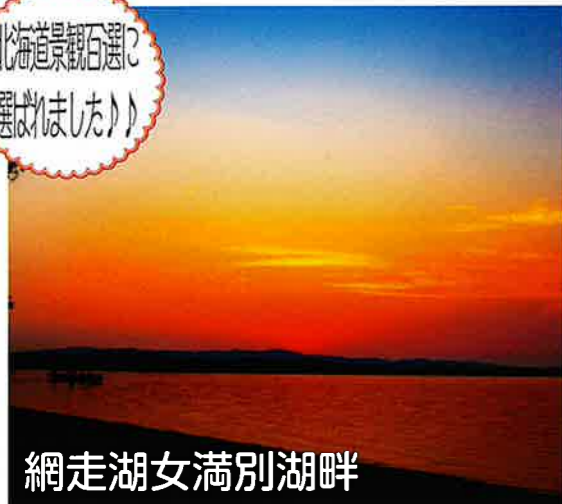
網走湖女満別湖畔