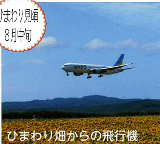
ひまわり畑からの飛行機